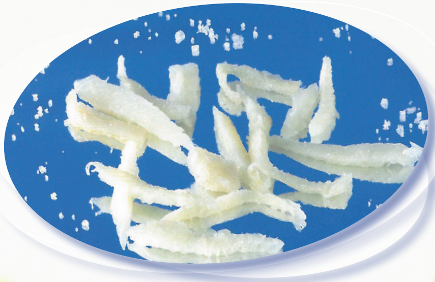
Desmigado salado 5,50 €/Kg* Desmigado desalado 5,50 €/Kg*