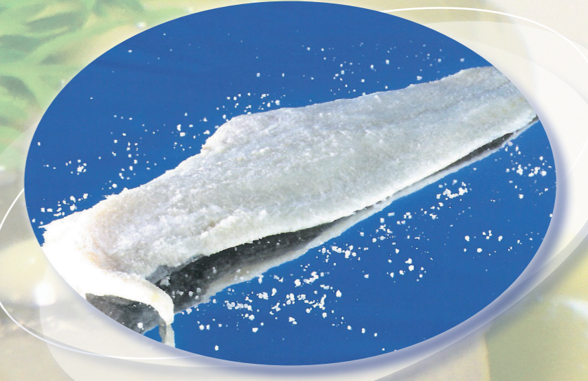
Filete 700/1.000 salado 9,50 €/Kg* Filete 700/1.000 desalado 9,50 €/Kg*