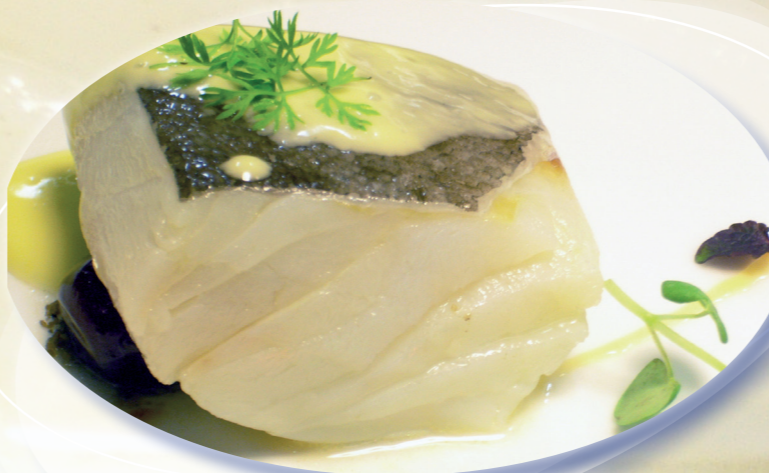
Taco salado 10,50 €/Kg* Taco desalado 10,50 €/Kg*