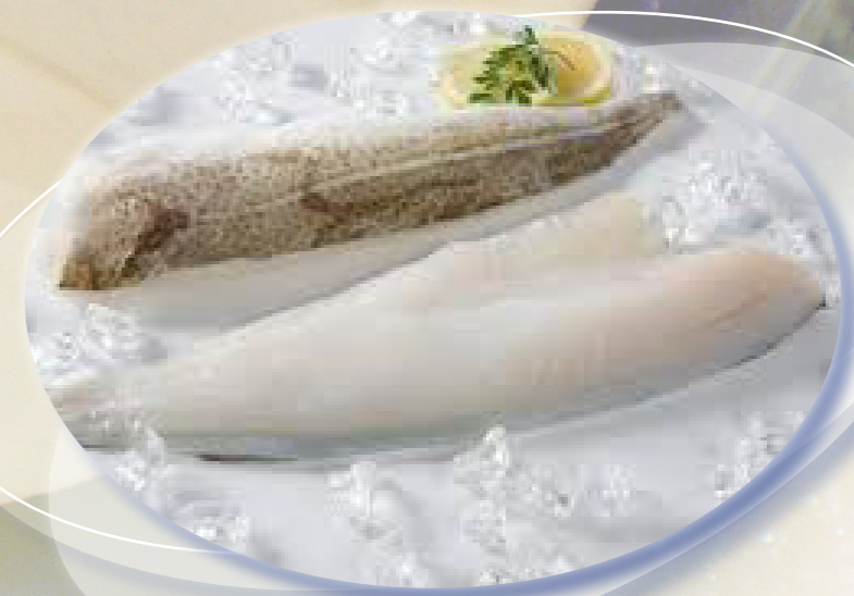
Filete Islandia congelado 7,00 €/Kg* 10 % Glaseado