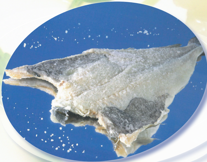
Bacalada 6,75 €/Kg*